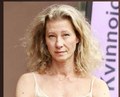
I Sverige anmäls i snitt drygt 50 fall av våld i nära relation om dagen. Det är fler än två per timme. Dygnet runt, året om.