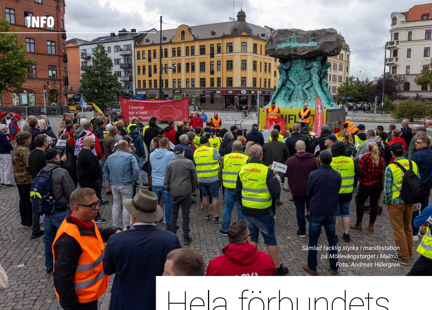
Samlad facklig styrka i manifestation på Möllevångstorget i Malmö.