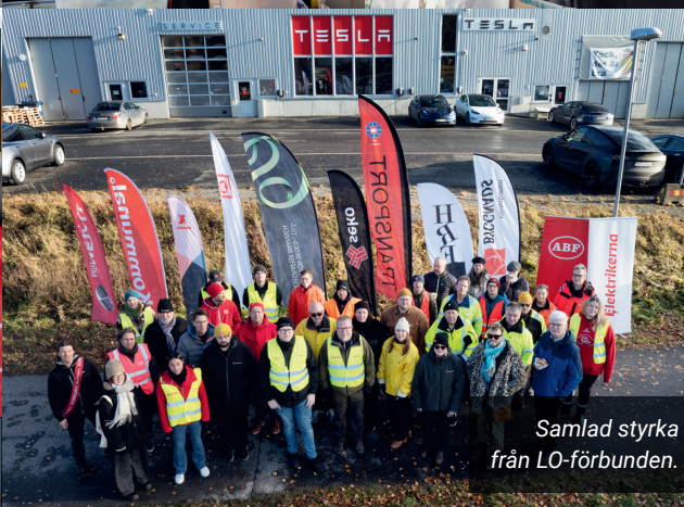
Samlad styrka från LO-förbunden.