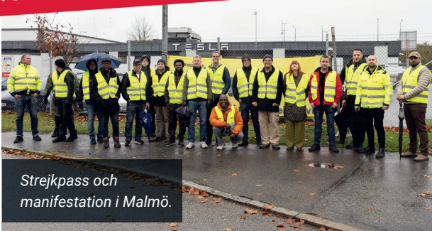
Strejkpass och manifestation i Malmö.