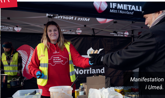
Manifestation i Umeå.