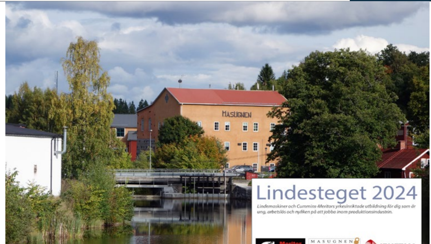
Lindesteget är AB Lindemaskiner och Cummins-Meritors yrkesinriktade utbildning för den som är ung, arbetslös och nyfiken på att jobba inom produktionsindustrin. Utbildningen sker i samarbete med IF Metall och lärosätet Masugnen i Lindesberg.

Text: Jan-Olov Carlsson och Iréne Ekblom