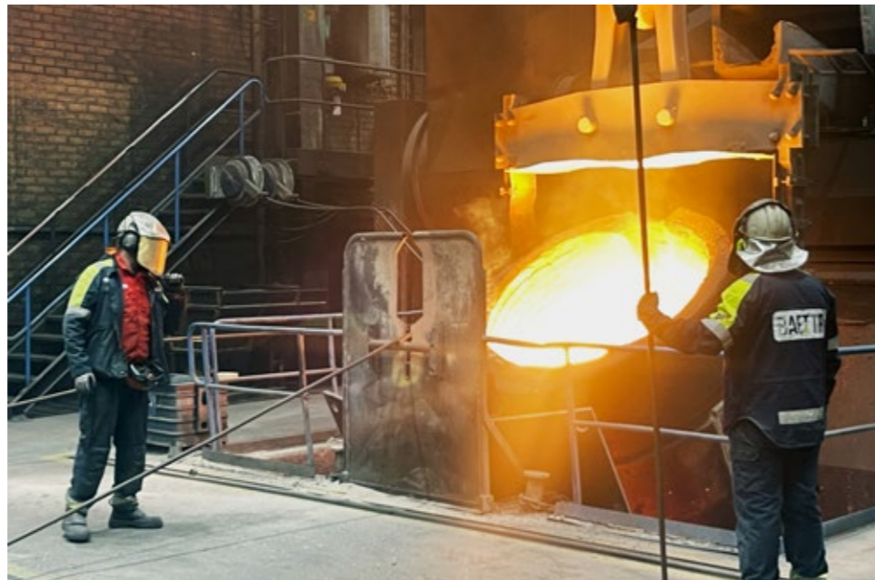
I dag är Guldsmidshyttan ett av de äldsta gjuterierna i världen som fortfarande är i drift.