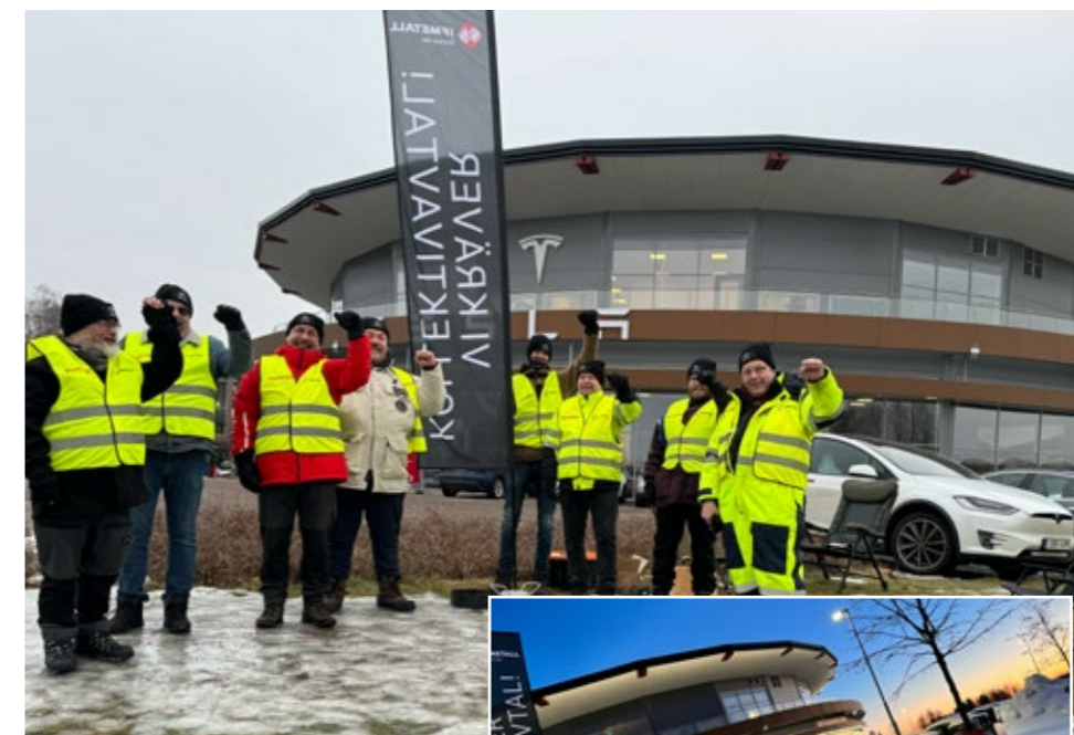
Värmlandsavdelningen var på besök i två dagar och stod strejkvakt.

Termometern visade på minus 22 grader. Men som ni vet; – vi står i alla väder!