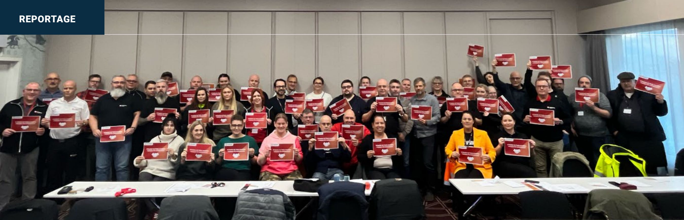
IF Metall Örebro läns representantskapsmöte passade på att ta en gemensam bild för att visa att vi står upp för medlemmarna på Tesla.