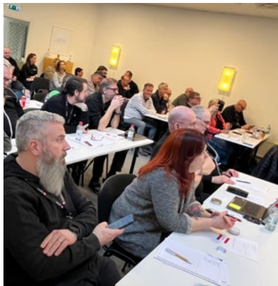
Representantskapsledamötena fyllde rummet.