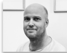
Fredrik Strid Zinkgruvan mining AB