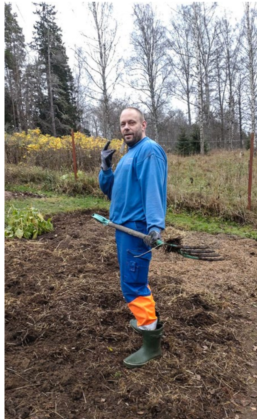
På gården i Hjortkvarn finns tre får och några höns. Mycket av Christian Holmbergs intressen handlar om djur och natur.

Text: Conny Dahlin och Jan-Olov Carlsson