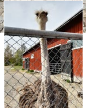
Till höger: En nyfiken struts som nog funderar över vad det är för underliga människor den ser.

Vårens pensionärsresa gick till Östergötland och Vikbolandet. Det var som vanligt två resor med ca 40 personer på varje resa.