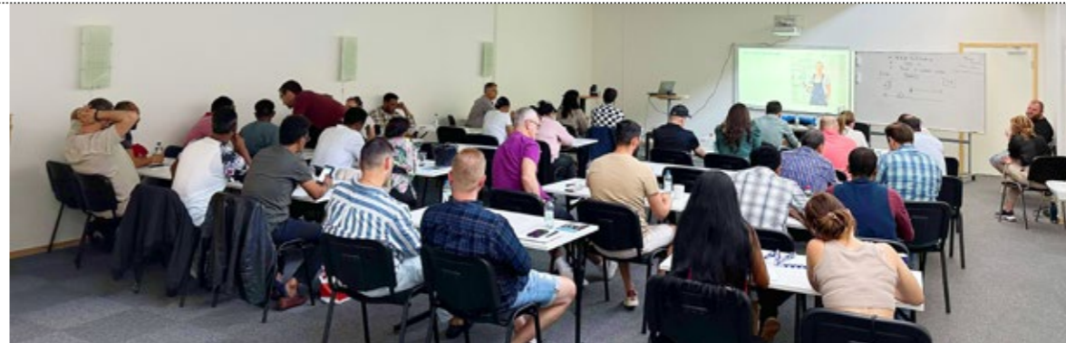
Medlemsutbildning vid Candles Scandinavia i Örebro, där man tillverkar ljus av alla möjliga slag.