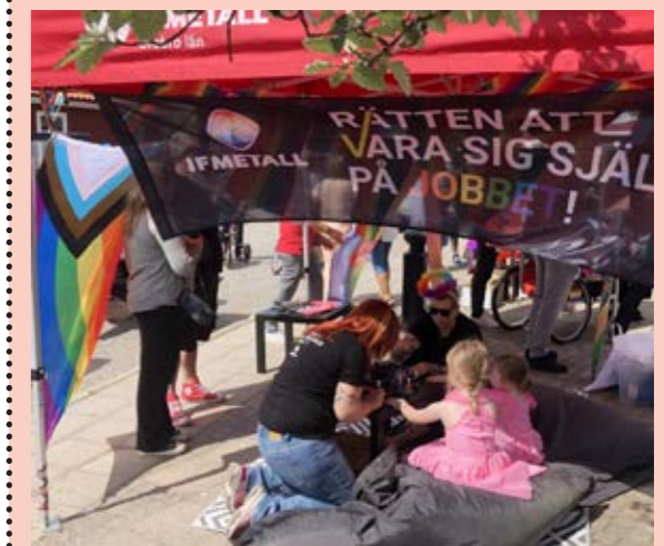
Den här dagen var i första hand riktad till barnen och deras familjer. Alla har sin plats under regnbågsflaggan.