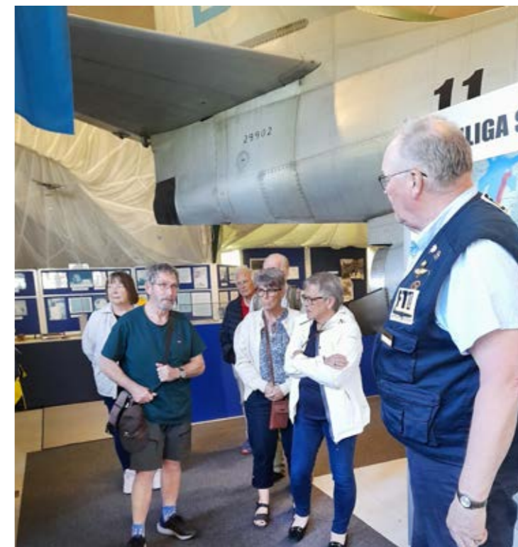
En engagerad guide berättar för en grupp deltagare.

Första stopp blev vid Djulö rastplats utanför Katrineholm. Platsen är vackert belägen vid ett vattendrag. Där serverades det som vanligt kaffe och smörgås från bussen. Resan gick sedan till Femörefortet utanför Oxelösund. Där inleddes med en guidad rundvandring både uppe på berget och inne i berget. Detta är en kustartillerianläggning som består av tre kanoner lite utspridda på ön. Detta för att kunna försvara Nyköping och Oxelösund som båda är viktiga hamnar. Anläggningen stod klar 1966 och blev museum 2003. Det finns plats för 70 personer att både bo och äta utan att behöva lämna bergrummet. Det var många trappor att ta sig både upp och ned men de flesta klarade det. Som sig bör blev det en lunch som intogs i hamnen i Oxelösund. Mätta och belåtna anträdde vi färden till Nyköping och flygmuseet på F 11 som nu går under benämningen Skavsta flygplats. Där blev vi uppdelade i mindre grupper och guidade runt hela museet med en mängd intressanta saker som vi