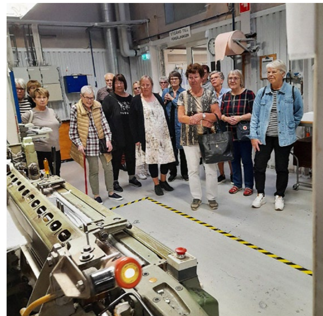
Intresserade besökare ser en vävstol i arbete vid Klässbols linneväveri.