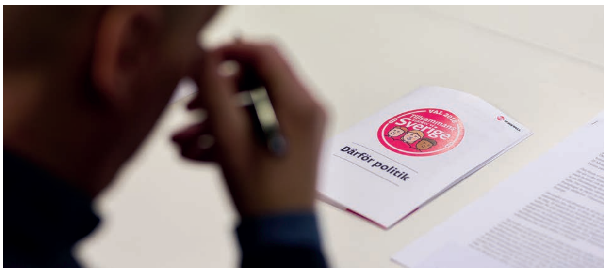
IF Metall engagerar sig fackligt-politiskt och samhällspolitiskt för att påverka beslut som är viktiga för medlemmarna.